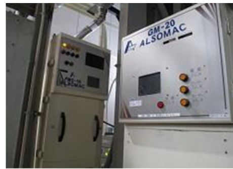
色彩選別機、異物選別機