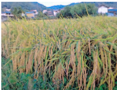
深水による栽培管理