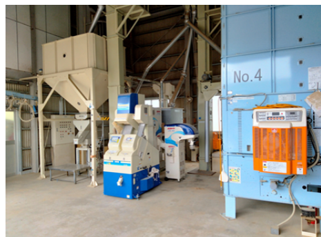
色選、石抜き、遠赤外線乾燥機