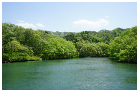
生活排水の入らない水利